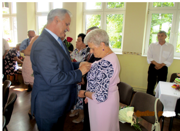
Uroczyste odznaczenia Jubilatów