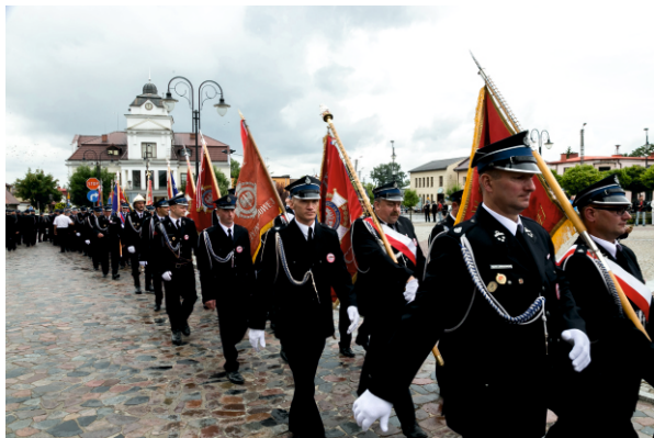
Uroczysty przemarsz pocztów sztandarowych

Następnie poczty sztandarowe wraz z uczestnikami uroczystości przemaszerowały na plac przed Gminnym Ośrodkiem Kultury w Bielsku.