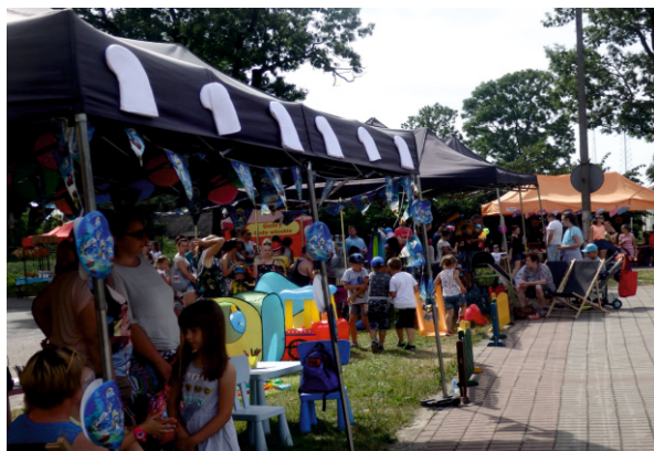
Stoiska na festynie