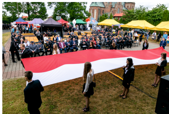
Flaga ku czci 100-lecia odzyskania niepodległości.