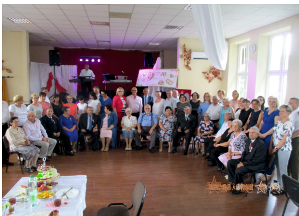
Zgromadzeni goście wraz z organizatorami

Każdy jubileusz jest okazją do świętowania, ale „Złote Gody” to jubileusz niezwykły, tak jak niezwykli są ludzie, którzy przeżyli razem pół wieku. Niezwykłe są też Medale za Długoletnie Pożycie Małżeńskie, którymi Prezydent RP odznacza pary. Symbolicznie wyrażają one uznanie władz polskich dla wartości życia i rodziny oraz wdzięczność za ofiarny, codzienny trud, odpowiedzialność, zgodność pożycia i poświęcenie.