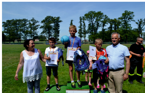
Uczestnicy na podium