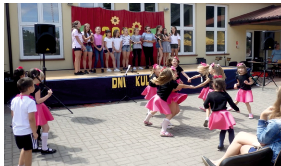
Występ wokalnie - taneczny