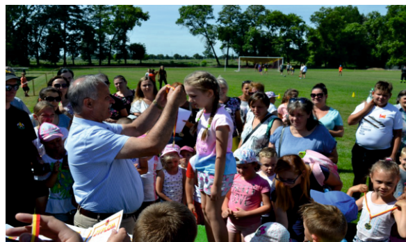
Wójt odznacza uczestniczkę biegu

w Bielsku, II miejsce zajął Mikołaj Folgier z Zespołu Szkół Nr 4 w Zagotach, a III miejsce Miłosz Słaby z Zespołu Szkół nr 2 w Ciachcinie.