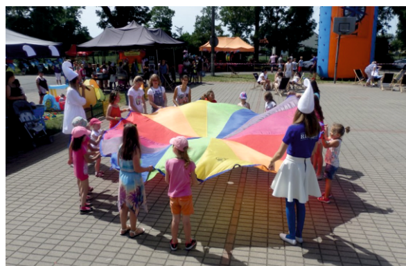
Dzieci podczas zabawy