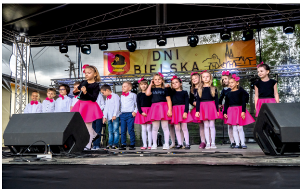
Występ najmłodszych artystów