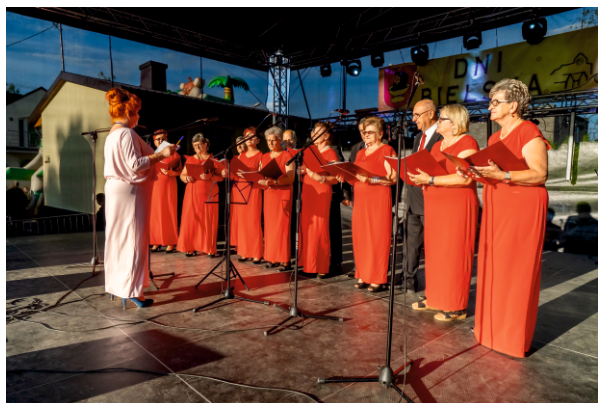
Występ chóru „Bielszczanie”