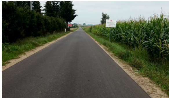
Nowa droga w Dębsku

Biskupie, Jaroszewo Wieś, Jączewo, Kuchary - Jeżewo, Bolechowice oraz Konary.