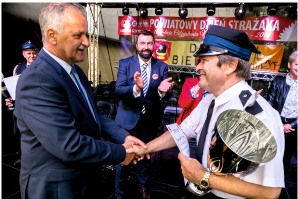
Odnaczenie zwycięskiej orkiestry

Wszystkie orkiestry otrzymały puchary, dyplomy oraz nagrody finansowe. Serdecznie wszystkim gratulujemy. Pierwszy dzień imprezy zakończyła tradycyjna już zabawa taneczna.