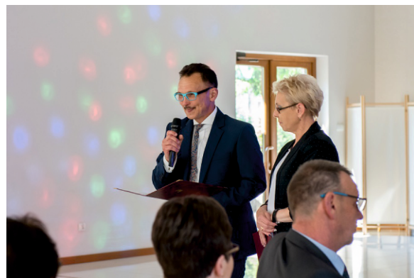
Goście zabrali głos

Od władz gminy i nauczycieli dostaliśmy piękne kwiaty i kosz słodczy za co jeszcze raz dziękujemy. Spotkanie odbyło się w serdecznej i bardzo radosnej atmosferze, były łzy wzruszenia, uśmiechy i uściski a wspomnienia nie miały końca. Wspólny śpiew i tańce trwały bardzo długo. Wszyscy czuli się młodo, szczęśliwie i byli zadowoleni, niech żałują ci, którzy nie dali się namówić na to spotkanie.