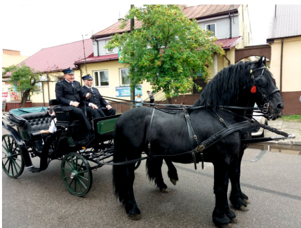
Dostojny powóz konny