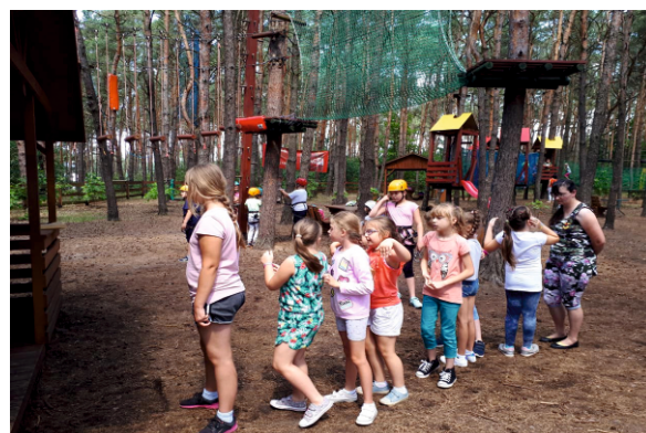
Park linowy w Borowiczkach

Kujawskiej za opiekę nad dziećmi, serdeczność i ciepłe słowa. Dzieciom dziękujemy za udział w półkoloniach, miłe doznania i wrażenia, które na długo pozostaną w naszej pamięci.