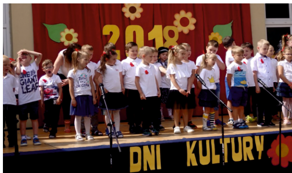
Występ młodych artystów

W dniu 12 czerwca 2018 r w Gminnym Ośrodku Kultury w Bielsku odbył się XX Przegląd Działalności Artystycznej „Dni Kultury 2018” .