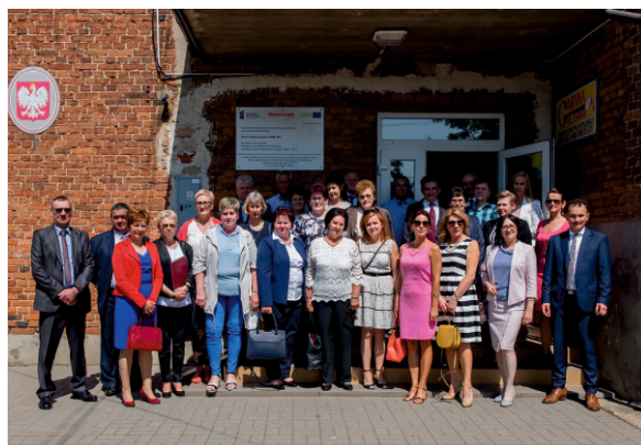
Absolwenci Szkoły Podstawowej w Bielsku rocznik 1977/78