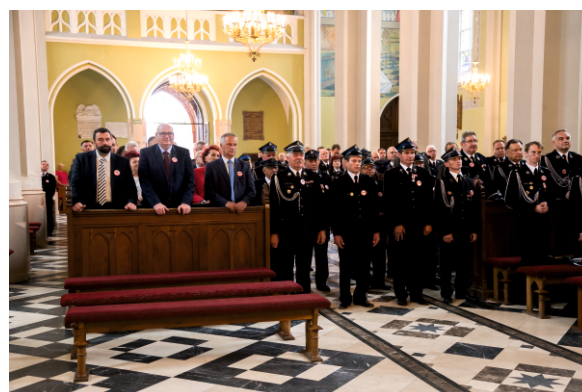
Podczas uroczystej mszy świętej