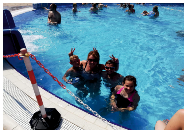
Aqua Park Termy Uniejów

Rodzicom pragnę przekazać, że mają mądre, cudowne i wartościowe dzieci, dla których warto poświęcać każdą chwilę. W imieniu wszystkich dzieci i ich rodziców składam szczególne podziękowania Wójtowi Gminy Bielsk oraz Komisji ds Rozwiązywania Problemów Alkoholowych za przekazanie środków na zorganizowanie kolonii. Dzięki tym funduszom nie tylko działalność GOKu kolejny raz została wzbogacana o nową ofertę ale przede wszystkim dała dzieciom możliwość spędzenia wakacji w sposób aktywny, przyjemny, atrakcyjny, poznając nowe miejsca i nowych ludzi. Wspólnie, mile spędzone chwile na długo pozostaną w pamięci naszych miłusińskich, a uśmiechy na ich twarzach będą nam przyświecały w dalszej pracy.