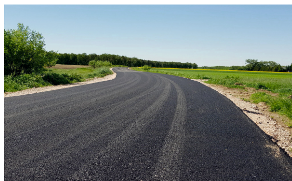
Nowa droga Umienino - Pęszyno

W bieżącym roku rozpoczęliśmy prace związane z przebudową i budową ulic osiedlowych w Bielsku. Zadanie realizowane będzie w cyklu trzyletnim. Inwestycja będzie obejmować wykonanie kanalizacji deszczowej, chodników, nawierzchni drogowej. Wartość całości prac to 6 milionów złotych. Na ten rok planowane są jeszcze prace związane z wykonaniem 1 km drogi asfaltowej w Dziedzicach , na które to zadanie pozyskaliśmy dofinansowanie z Urzędu Marszałkowskiego Woj. Mazowieckiego oraz wykonanie remontu prawie 7 km dróg metodą poczwórnego powierzchniowego utrwalenia nawierzchni emulsją asfaltową w miejscowościach: Lubiejewo – Leszczyn Księży, Niszczyce – Żągoty, Niszczyce, Rudowo, Tchórz, Umienino, Gilino – Kuchary - Jeżewo i w m. Bielsk (ul. Glinki i Medyczna) Wszystkie inwestycje drogowe zrealizowane w naszej gminie z pewnością przyczyniły się do poprawy życia naszych mieszkańców i zwiększyły atrakcyjność terenów dla potencjalnych inwestorów.