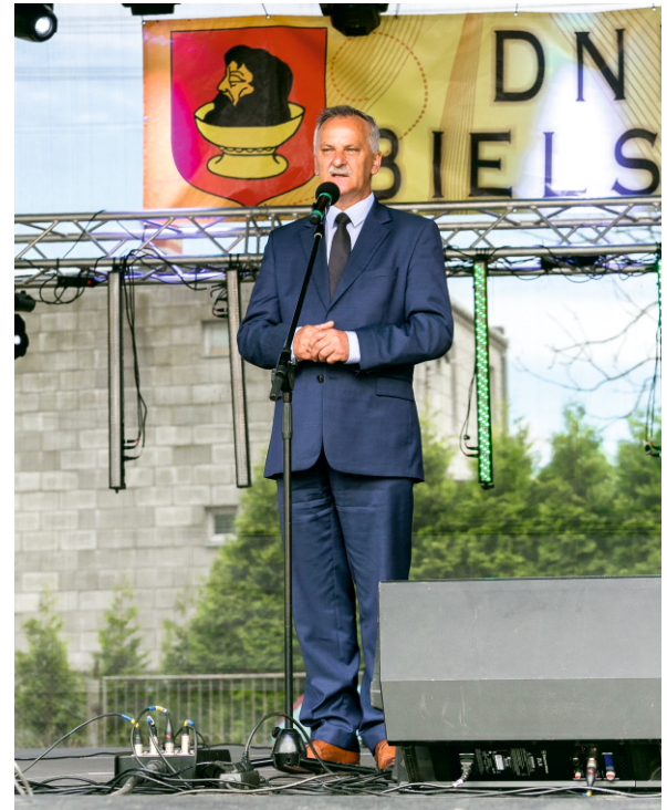
Oficjalne otwarcie drugiego dnia uroczystości

Wszystkie orkiestry otrzymały puchary, dyplomy oraz nagrody finansowe. Serdecznie wszystkim gratulujemy. Pierwszy dzień imprezy zakończyła tradycyjna już zabawa taneczna.