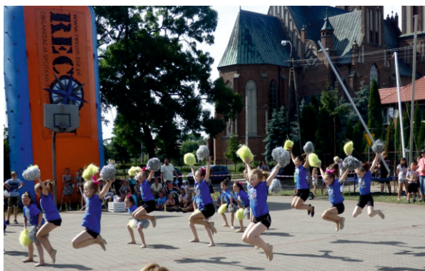
Występ grupy cheerleaders

9 czerwca odbył się już V Festyn Rodzinny zorganizowany przez Wójta Gminy Bielsk i Gminny Ośrodek Kultury w Bielsku dla najmłodszych mieszkańców naszej gminy i ich rodzin. Na dzieci czekało mnóstwo atrakcji: zjeżdżalnia, bungie, ścianka wspinaczkowa, ogródek zabaw dla najmłodszych i wioska smurfów. Każdy mógł sobie pomalować buźkę, zjeść watę cukrową a dla dziewczynek było stoisko z kolorowymi warkoczami.