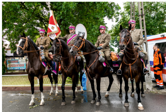
Ułani ze Stowarzyszenia Patria Polonia z Płocku