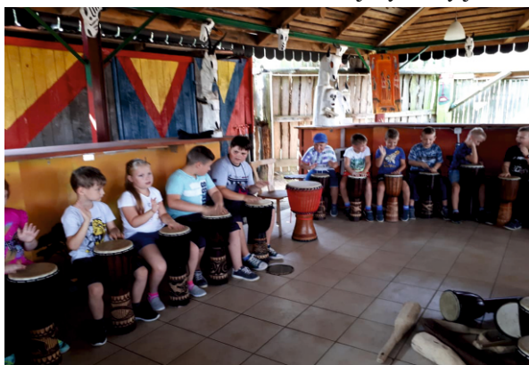
Wioska Afrykańska w Sobowie

Z każdego wyjazdu dzieci wracały bardzo zmęczone lecz naładowane pozytywną energią w oczekiwaniu na kolejny wyjazd.