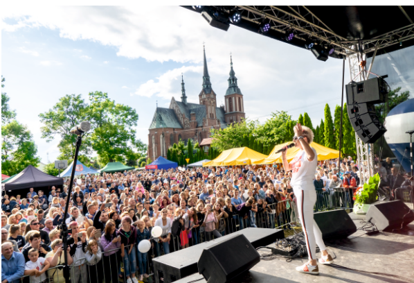
Występ zespołu „Piękni i Młodzi”