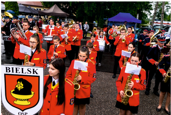
Występ orkiestry OSP Bielsk

Oficjalne uroczystości zakończył Powiatowy Przegląd Orkiestr Dętych, w którym wzięło udział dziewięć orkiestr dętych z terenu powiatu tj.: Orkiestra Dęta przy OSP w Słubicach, Orkiestra Dęta przy OSP w Gąbinie, Gminna Orkiestra Dęta w Łącku, Orkiestra Dęta przy OSP w Bielsku, Gminna Orkiestra Dęta w Staroźrebach, Gminna Orkiestra Dęta w Starej Białej, Orkiestra Dęta przy OSP w Drobinie, Orkiestra Dęta przy OSP w Rębowie, Orkiestra Dęta przy Zespole Szkół Technicznych w Płocku. I miejsce zajęła Orkiestra Dęta przy OSP w Drobinie, II miejsce Gminna Orkiestra Dęta w Starej Białej, III miejsce Orkiestra Dęta przy ZST nr 70 w Płocku.