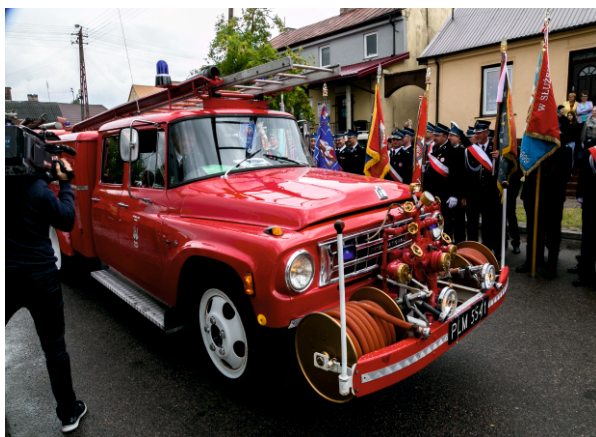
Pokaz samochodów strażackich

Wycie syren strażackich zapoczątkowało kolejną atrakcję, przez centrum Bielska przejechała parada blisko stu pojazdów pożarniczych, gdzie oprócz najnowocześniejszych samochodów mogliśmy zobaczyć historyczne strażackie powozy konne. Całą paradę prowadzili ułani ze Stowarzyszenia Patria Polonia w Płocku.