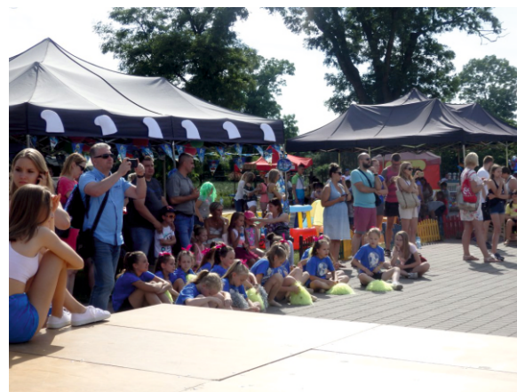
Zgromadzeni uczestnicy festynu