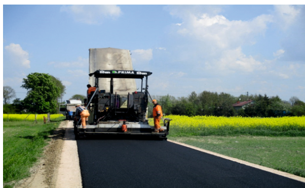
Remont Drogi Ciachcin - Kuchary-Jeżewo - Józinek - Leszczyn Księży

W obecnej kadencji, wzorem lat ubiegłych jednym z głównych naszych priorytetów było zmodernizowanie sieci dróg gminnych . Jak ważne są to inwestycje z pewnością zauważy każdy mieszkaniec naszej gminy. W ciągu ostatnich trzech lat udało się zmodernizować drogi o łącznej długości ponad 17 km . Największą zakończoną inwestycją drogową ostatnich lat było wybudowanie 4,2 km odcinka asfaltowego wraz z infrastrukturą towarzyszącą w miejscowościach: Ciachcin, Kuchary - Jeżewo, Józinek i Leszczyn Szlachecki . Na tę inwestycję pozyskaliśmy środki finansowe z Programu Rozwoju Obszarów Wiejskich na lata 2014 – 2020.