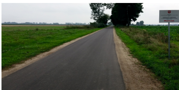
Zmodernizowana droga Rudowo - Leszczyn Szlachecki

W latach 2015 – 2017 udało się nam wykonać 1,7 km odcinek drogi asfaltowej w miejscowościach Dębsk – Tłubice. W cyklu dwuletnim została wybudowana droga o długości ponad 2 km, która łączy miejscowości Leszczyn Księży i Rudowo , na którą pozyskaliśmy 50% dofinansowanie z Urzędu Marszałkowskiego Woj. Mazowieckiego. Również w cyklu dwuletnim został zmodernizowany prawie 3 km odcinek drogi Umienino – Pęszyno . W ostatnim roku wykonano nawierzchnie emulsyjne o łącznej długości około 6,3 km w miejscowościach: Jaroszewo