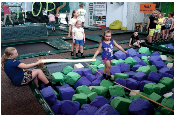
Podczas zabaw w Happy Parku w Stróżewku

Dzięki przychylności Wójta Gminy Bielsk oraz Gminnej Komisji ds Profilaktyki i Rozwiązywania Problemów Alkoholowych, Gminny Ośrodek Kultury już po raz trzeci zorganizował półkolonie dla dzieci pn. „Lato z Gokiem”, w których udział wzięło 80 dzieci z terenu naszej gminy. W programie, który został przygotowany nie było miejsca na nudę. Oprócz gier, zabaw i zajęć sportowych w których dzieci chętnie brały udział, zorganizowaliśmy szereg wyjazdów, które sprawiły dzieciom ogromną radość, min: Centrum Zabaw Happy Park w Stróżewku, Wioska Afrykańska w Sobowie, Park Trampolin Adrenalina w Płocku, Park Linowy w Borowiczkach, Aqua Park Termy Uniejów, Kręgielnia Dębowa w Płocku oraz Ranczo Boguszewiec.