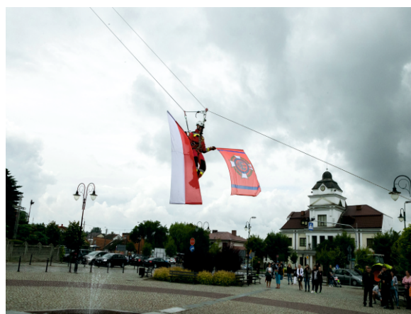
Zjazd z flagami podczas uroczystości

Po mszy, z wieży kościoła z rozwiniętymi flagami zjechał członek Grupy Ratownictwa Specjalistycznego OSP Płock - Podolszyce.